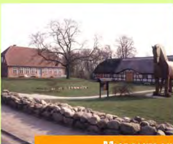
Museum und Trojanisches Pferd