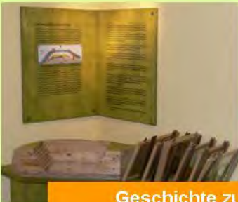
Geschichte zum Anfassen