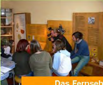
Das Fernsehen im Museum