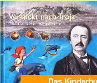
Das Kinderbuch „Verrückt nach Troja“