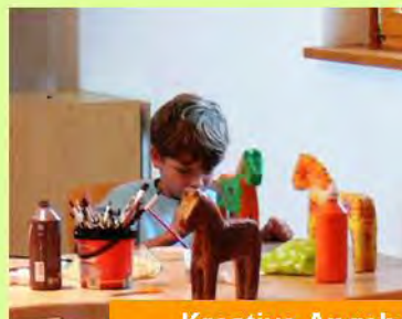
Kreative Angebote für Gruppen